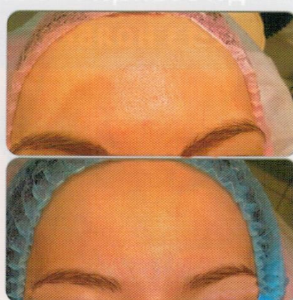
Себорея: а) до лечения; б) после лечения