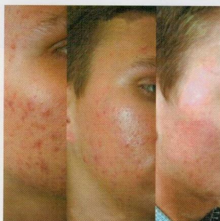
Акне: а) до лечения; б) середина курса; в) после лечения